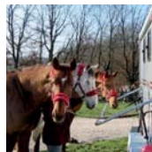
BARRA DI ALLONTANAMENTO