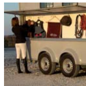
LATERALI DI SISTEMAZIONET